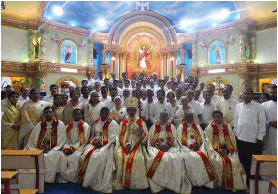
മണ്ഡ്യ രൂപത വിൻസെന്റ് ഡി പോൾ