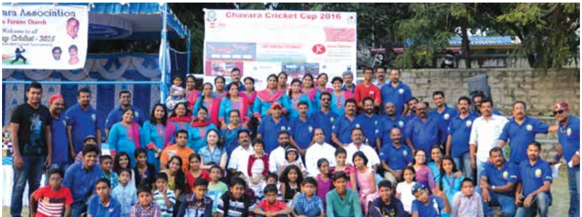
Holy Eucharist Church Mangammappalya Beat St. Josephs and Claret Church, Dasarahalli in the Chavara Cup Cricket Conducted by St Chavara Association of St. Thomas Forane Church on 12th and 13th November 2016 at Dharmaram Grounds